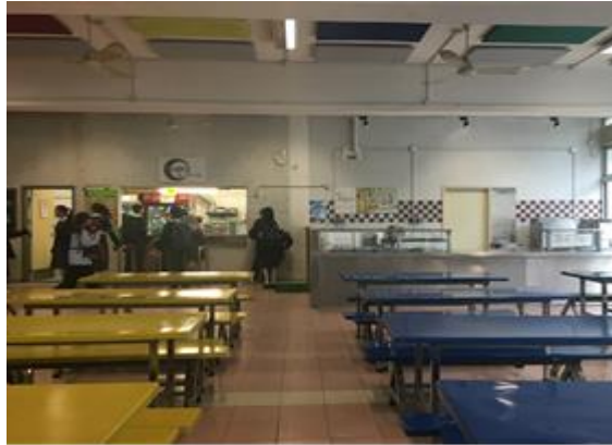
左：食物部 右：中央廚房